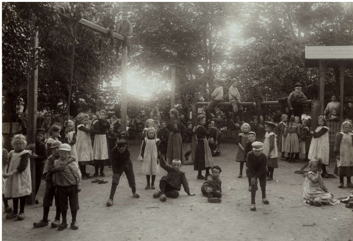
Skolgård i Fru Alstad socken, Skåne 1906. NMA.0032330.