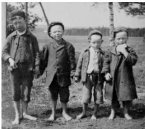
Fyra barfota pojkar från Jeppetorp fattiggård i Örebro, 1913. NMA.0033630.