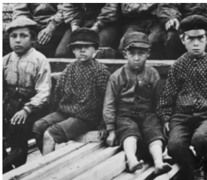
Pojkar på Sunds sågverk i Medelpad, cirka 1895. NMA.0043129.