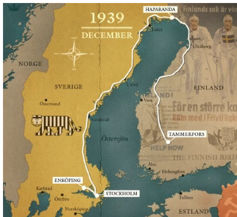
Intos resa vintern 1939. Into minns att tåget var fullt av barn och att de fick äta bullar i Haparanda.