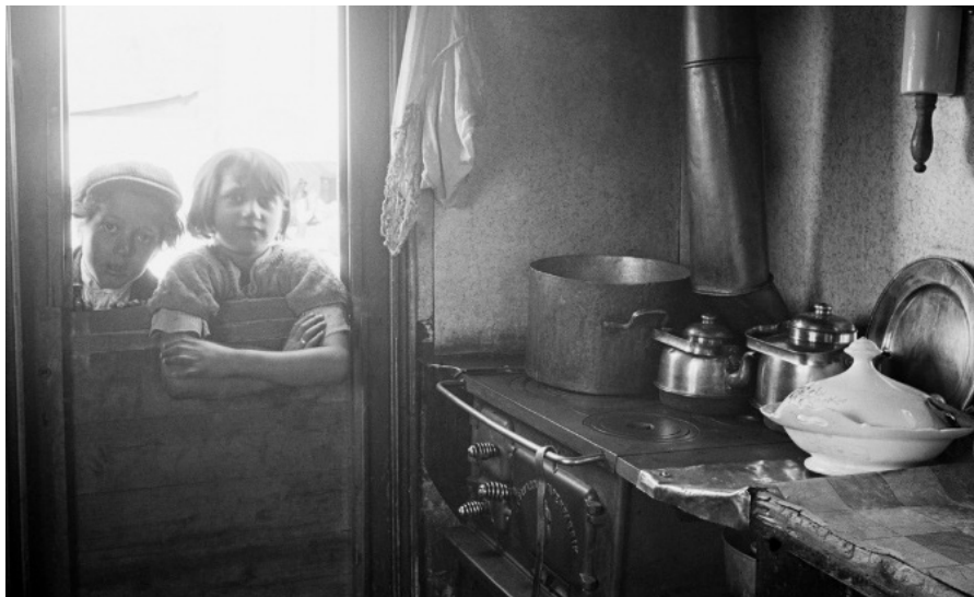
Två barn tittar in i en av familjen Taikons bostadsvagnar. Stockholm cirka 1930. NMA.0074079.