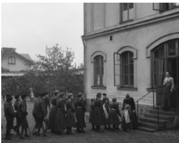
Barn med kryckor på väg in i skolsalen på Eugeniahemmet i Stockholm, cirka 1900. NMA.0040749.