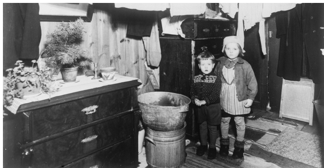
Trångbodd familj någonstans i Sverige, 1920–40-tal. NMA.0036254.