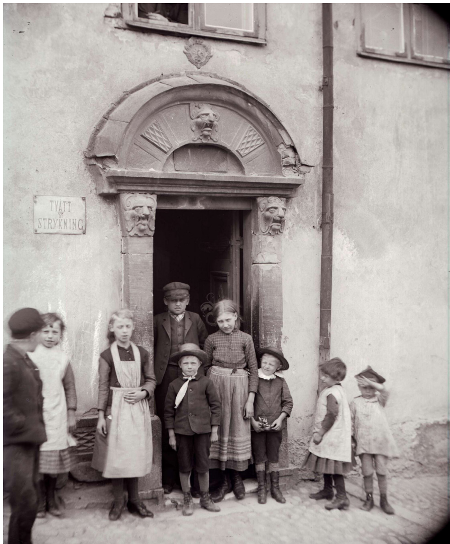
Barn utanför en port i Stockholm, cirka 1880–1900. NMA.0052524.