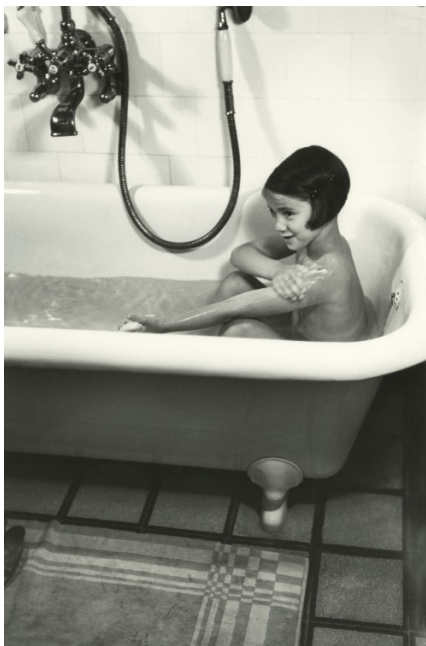
Flicka i badkar. Cirka 1940–1949. NMA.0062254.