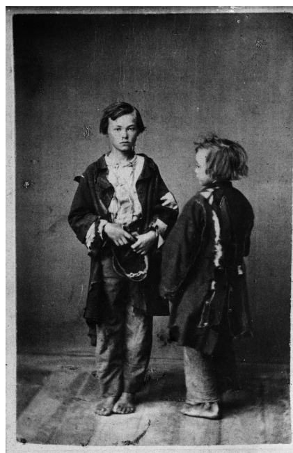
Två pojkar från den Lindgrenska Trasskolan på Södermalm i Stockholm, 1870. NMA.0033220.