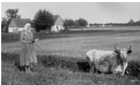
Kanske läsläsning? Äldre flicka i Skåne tidigt 1900-tal. NMA.0041246.