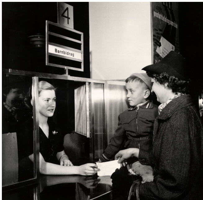
Barnbidrag cirka 1955. NMA.0030038.