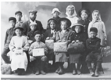
Barn från Karesuando, Norrbotten på skolresa 1913. NMA.0041246.