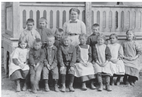
Skolklass cirka 1900. NMA.0039418.