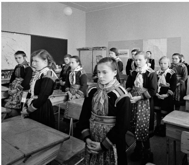
Morgonbön i Jukkasjärvi nomadskola, Norrbotten, cirka 1955–1960. NMA.0029876.