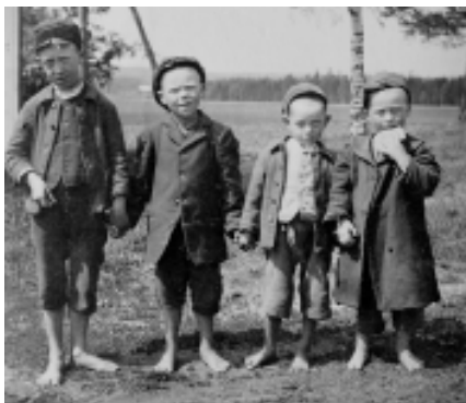
Fyra barfota pojkar från Jeppetorp fattiggård i Örebro, 1913. NMA.0033630.