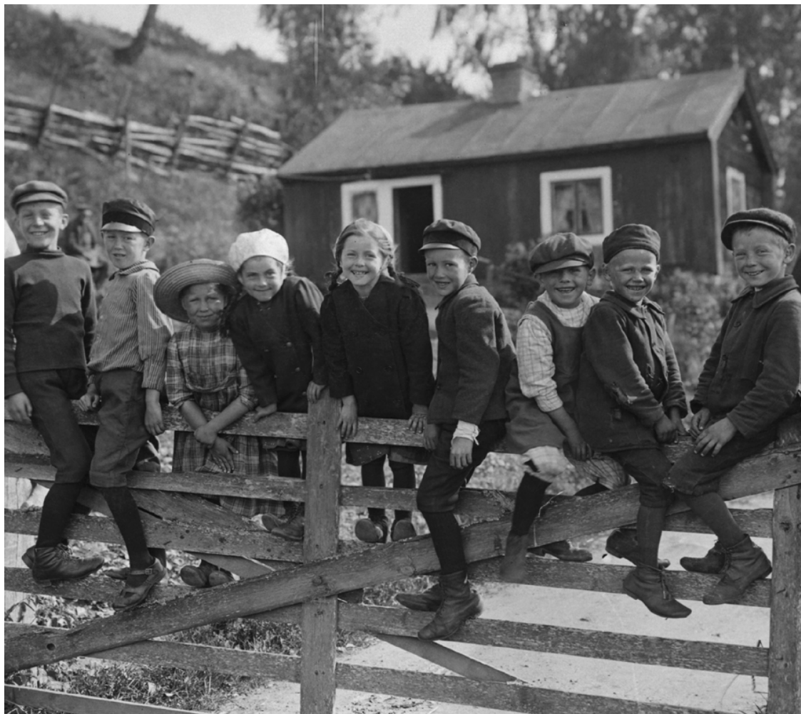
Barn sitter på en grind i Småland 1920-tal. NMA.0052446.