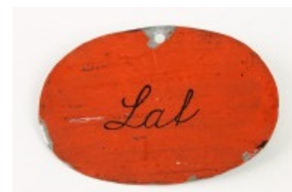
Bestraffningsbricka med ordet lat. NMA.0275015.