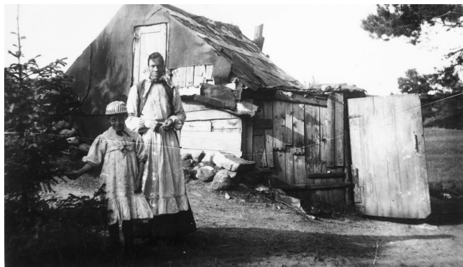
Flicka med sin mamma i Enschede, Stockholm 1906. NMA.0036257.