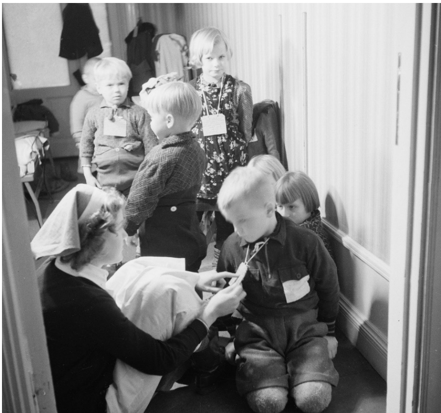
Finska barn som just kommit till Sverige. Runt deras halsar hänger deras namn, cirka 1939–1940. NMA.0036830.