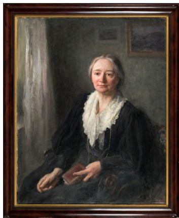
Ellen Key (1849–1926) NMA.0205569.