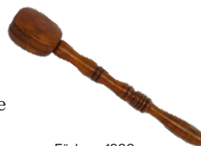
Färla ca 1900. NMA.0276547.

På bilden till höger ser du en färla. Det var ett redskap som lärare kunde använda när de slog sina elever. Även pekpinnar och andra redskap kunde användas. Lärare kunde också straffa elever genom annan kränkande behandling till exempel att hänga en skylt med nedsättande ord runt elevens hals. Om en elev skötte sig bra kunde den få en skylt med ett positivt ord i stället.